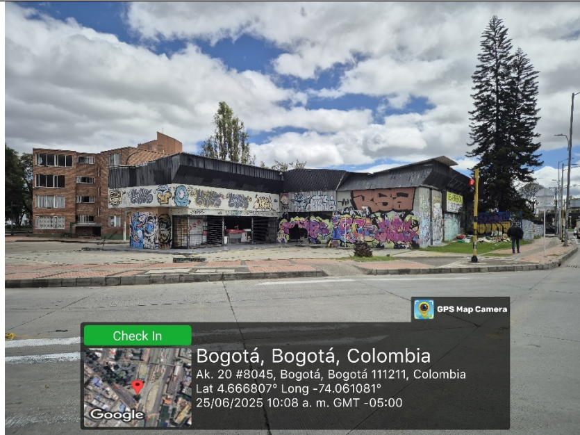
Foto 1. Vista panorámica del predio con nomenclatura Av. Carrera 20 No. 80 - 15 (dirección catastral), orientación NORTE - SUR .