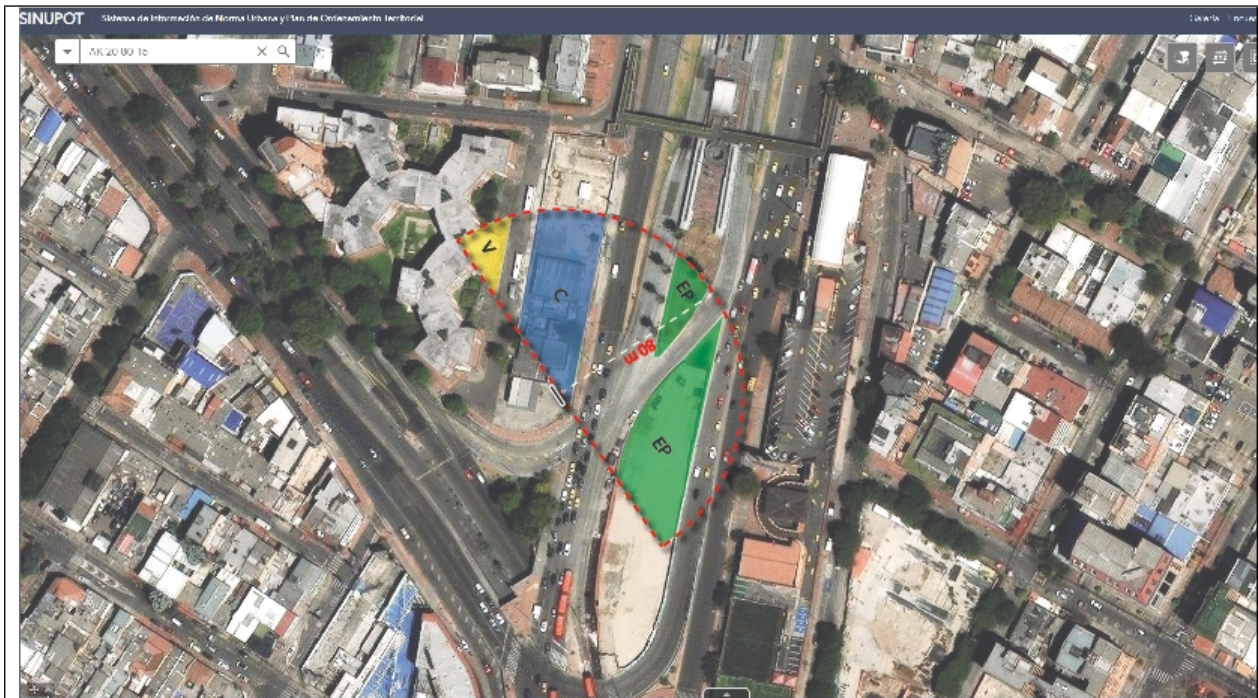
Imagen 1. Verificación radio lumínico para la valla publicitaria con innovación tecnológica ubicada en la Av. Carrera 20 No. 80 - 15 (dirección catastral), orientación NORTE - SUR .